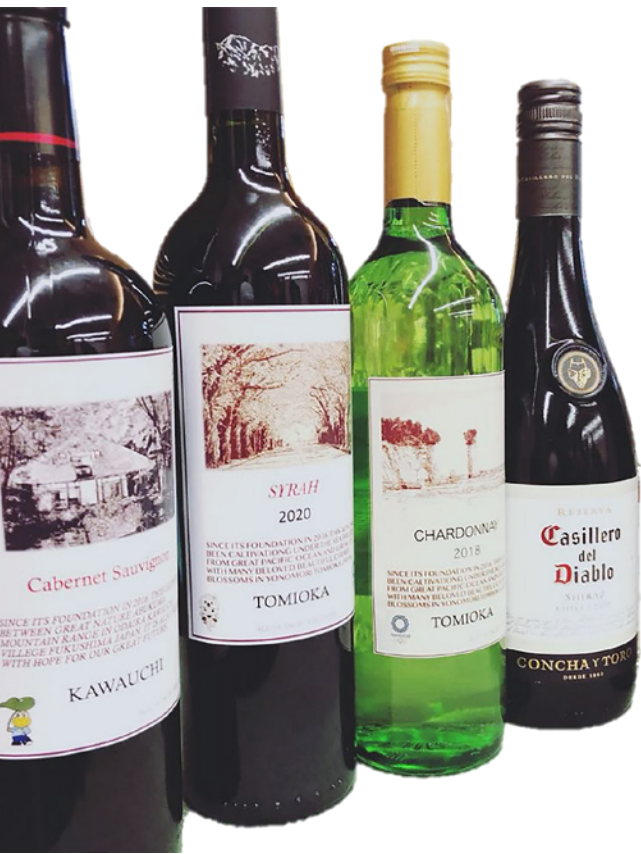
▲ 夜ノ森の桜のトンネルとロウソク岩をモチーフにしたラベルのイメージ。